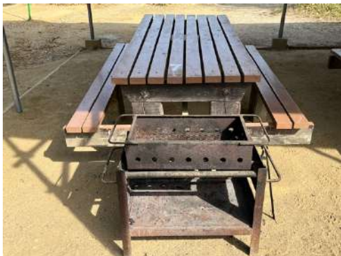
テーブルとイス、カマドと炭箱

1 テーブルにつき最大8名ご利用可能で、校外学習では6名が目安です。 また、1 テーブルにつき 1 基のカマドがついています（火バサミ付）。