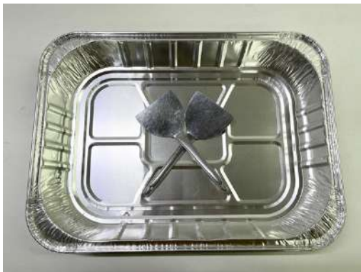
焼きそばプレート