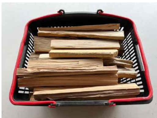
薪 (食材の準備ができてから火をつける)