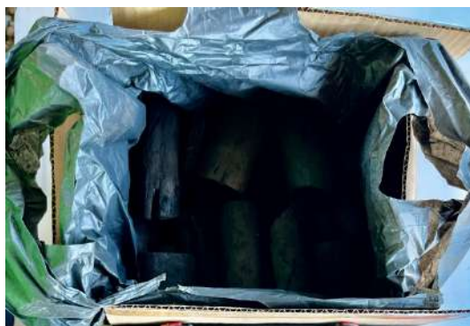
木炭一箱 3 キロ (着火から 30 分程で食材を焼き始められます)