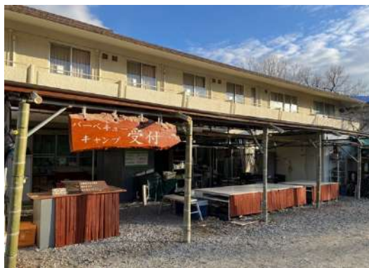
レンタル品、販売物の受け渡し場所 (本館入口東側)