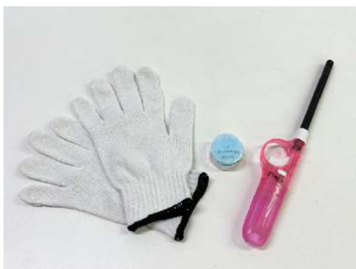
軍手、着火剤、ライター