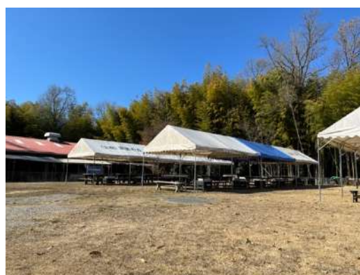
おおくま村 (18 テーブル、冷蔵庫無)