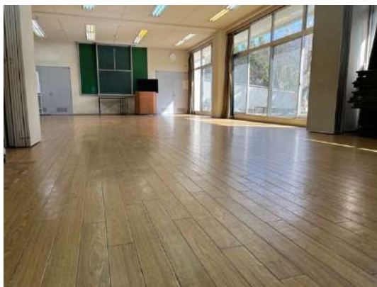
研修室（勉強合宿も可能）