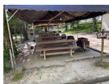
どんぐり村 (6 テーブル、冷蔵庫大 1)