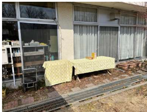
食材の受け渡し場所 (本館入口西側)