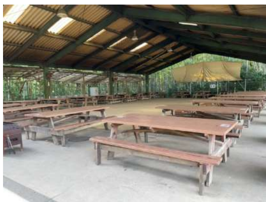
うめのさと (24 テーブル、冷蔵庫大 1、小 2)