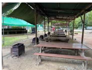
たんぼぼ村 (12 テーブル、冷蔵庫小 2)