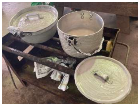
コーティングの例

炊事小物セットも洗って返却してください。しゃもじに米粒が残っていることがよくあります。カゴに付いているリストの物品が、揃っているかを確認し、返却してください。数が足りていない場合は、返却受け取りできません。