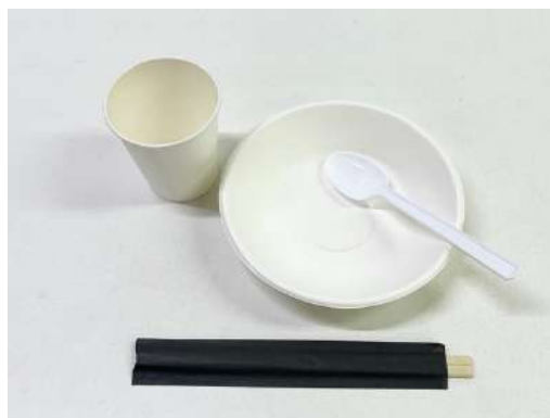
紙コップ、紙小ボウル (15 センチ)、 プラスプーン、割り箸