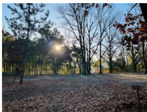
友愛の森（他複数サイト有）