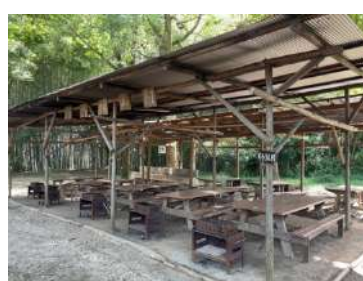
ちろりん村 (8 テーブル、冷蔵庫無)