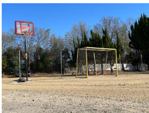
グラウンド（30×25 メートル）