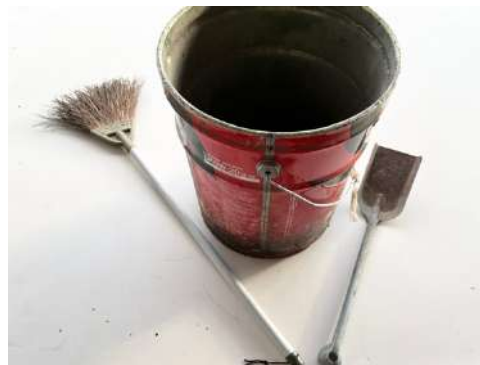
ほうき、灰炭バケツ、じゅうのう

炭箱（上、木炭を使用する場合、炭箱に木炭を入れ、その上に焼き網、焼きそばプレートを置きます） カマド（下、薪を使用する場合、炭箱を移動させて、カマドの中で薪を組み、この上に鍋や鉄板を置きます） 使用後は、指定された道具で清掃してください。 傷みますので、カマドや炭箱に水をかけないでください。