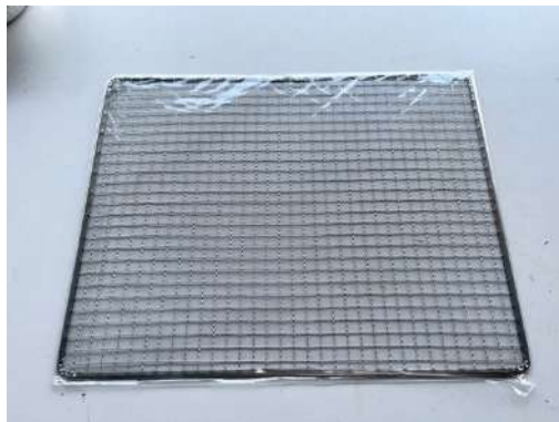
焼き網 (35×45 センチ)